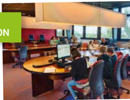
Atelier de travail avec le conseil jeunes aux archives départementales, le 22 avril 2024 pour travailler sur la future exposition consacrée à l'histoire de la commune.