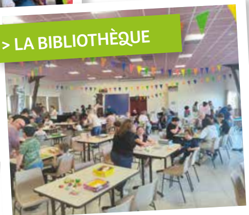
La bibliothèque de Saint-Sylvain organise la 1 ère édition de la fête du jeu, le 13 avril 2024, à la salle polyvalente