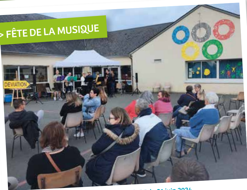
Organisation de la fête de la musique par l'APE, le 21 juin 2024.