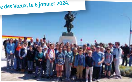
Dans le cadre des commémorations du 80 ème anniversaire du débarquement, les élèves de CM1 et CM2 sont venus en visite à Colleville-Montgomery. À l'occasion, ils ont visité le site Hillman, le 7 juin 2024.