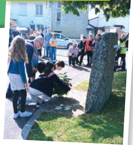
Cérémonie du 8 mai 1945 en présence des élus, du Conseil municipal jeunes et de l'association des anciens combattants.