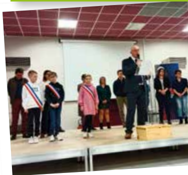
Cérémonie des Vœux, le 6 janvier 2024.