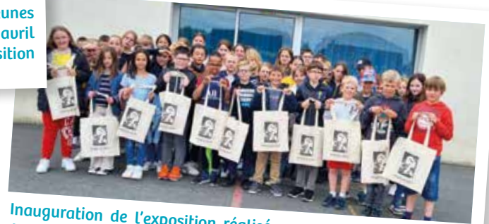
Inauguration de l'exposition réalisée par les élèves de l'école Jean Nourrisson en lien avec les enseignants, le 11 juin 2024 : deux classes de l'école Jean-Nourrisson exposent une histoire du Débarquement illustrée avec des timbres.